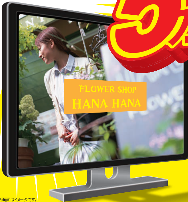
※画面はイメージです。